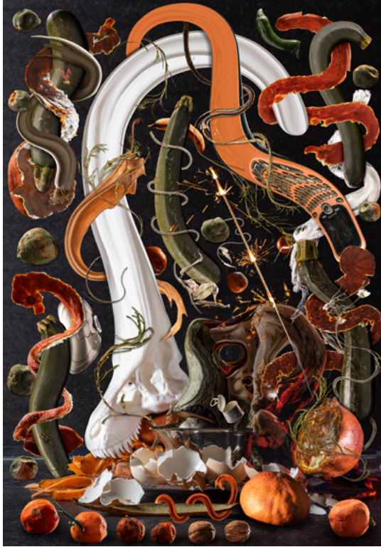
↗ Le 7ème continent, 2022