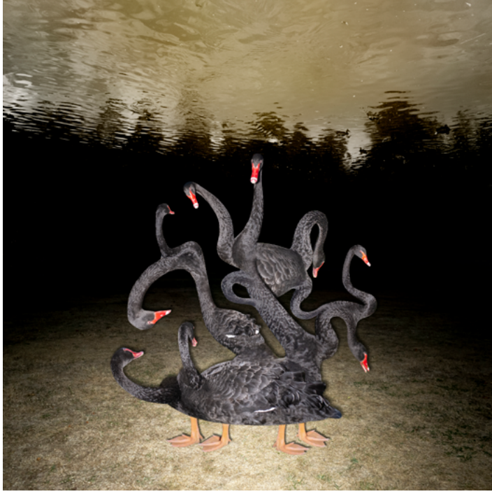
↗ Là d'où je viens , 2020 © Robin Lopvet