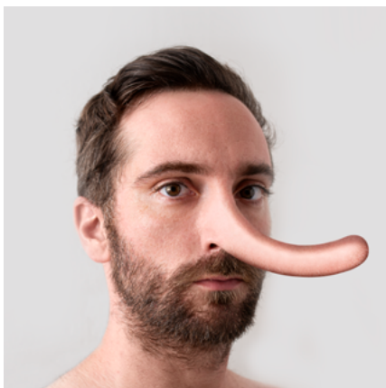
Pinocchio , 2023 ©Robin Lopvet

DJ en parallèle, il cogère le label Club Late Music. Il vit et travaille entre Arles, Paris et Internet.