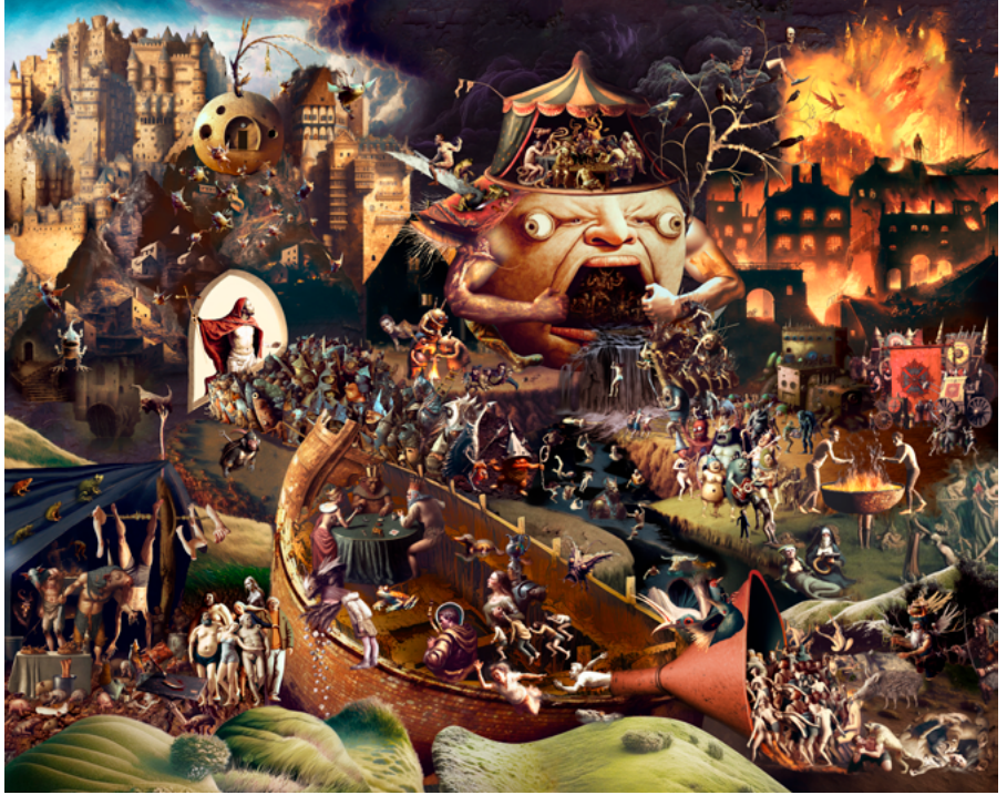
↗ Christ aux Limbes , 2023 © Robin Lopvet