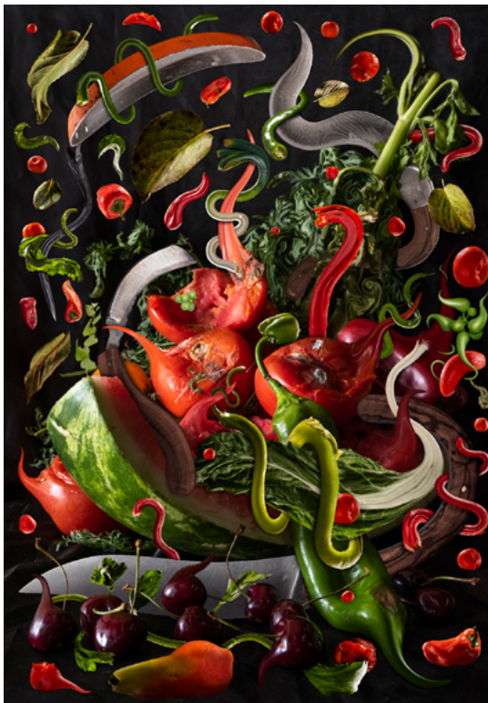
→ Le 7ème continent, 2022 © Robin Lopvet