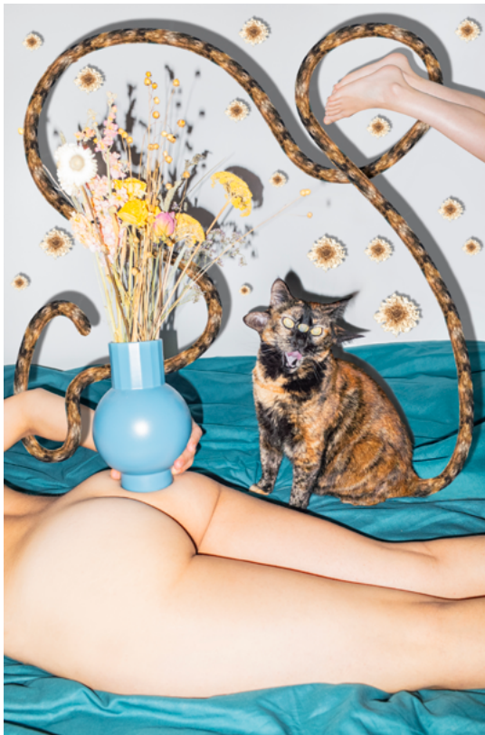
→ Prémices , 2022