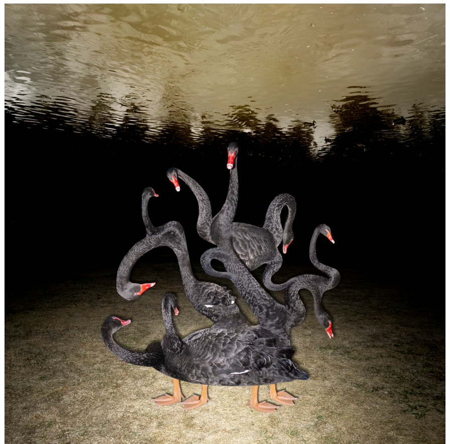
Là d'où je viens, 2020

+33 [0]3 27 43 56 50 contact@crp.photo www.crp.photo