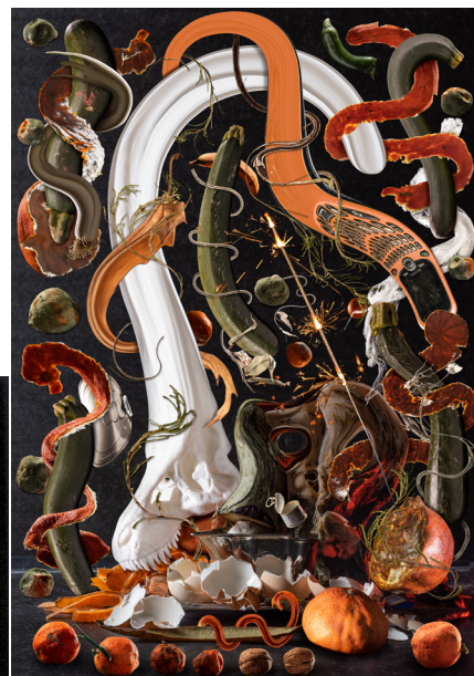
Le 7ème continent, 2022