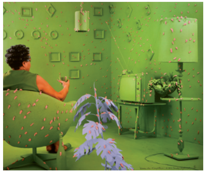
Sandy Skoglund, Germs Are Everywhere , 1983 Musée d'art et d'archéologie d'Aurillac