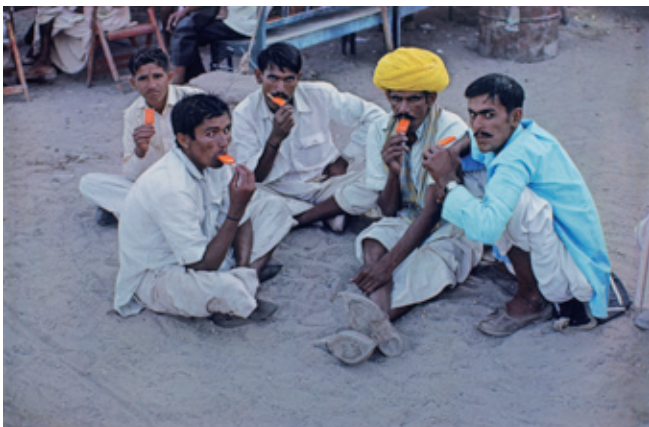
Raghubir Singh, Men Eating Popsicles , Jodhpur, 1981 Musée d'art et d'archéologie d'Aurillac