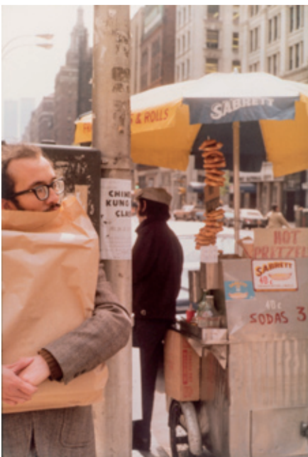
Helen Levitt, Sans titre, 1976 Musée d'art et d'archéologie d'Aurillac