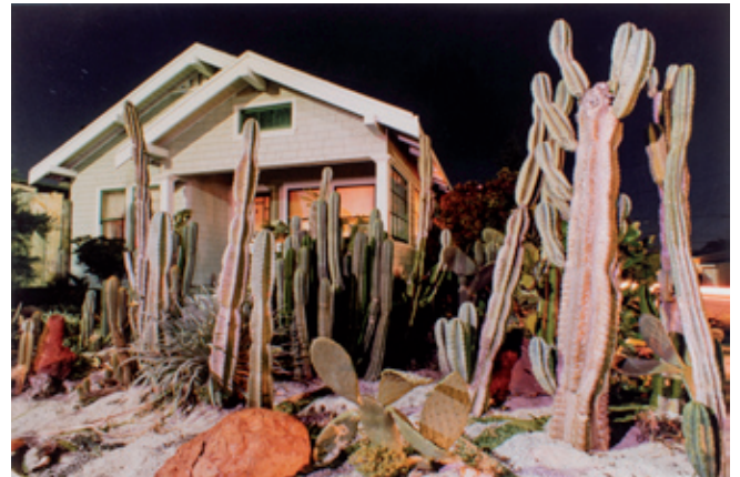
Arthur Ollman, Maison avec cactus , 1980 Musée d'art et d'archéologie d'Aurillac