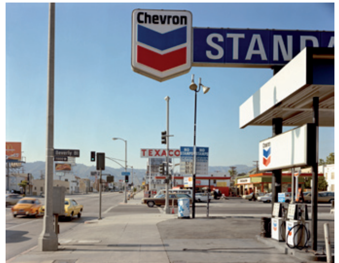
Stephen Shore, Beverly Boulevard and La Brea Avenue, Los Angeles, California, June 21, 1975, 1975 Fotomuseum Antwerpen