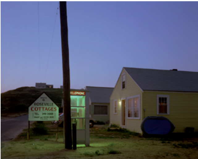
Joel Meyerowitz, Roseville Cottages, Truro, Massachusetts, 1976 Collection Florence et Damien Bachelot