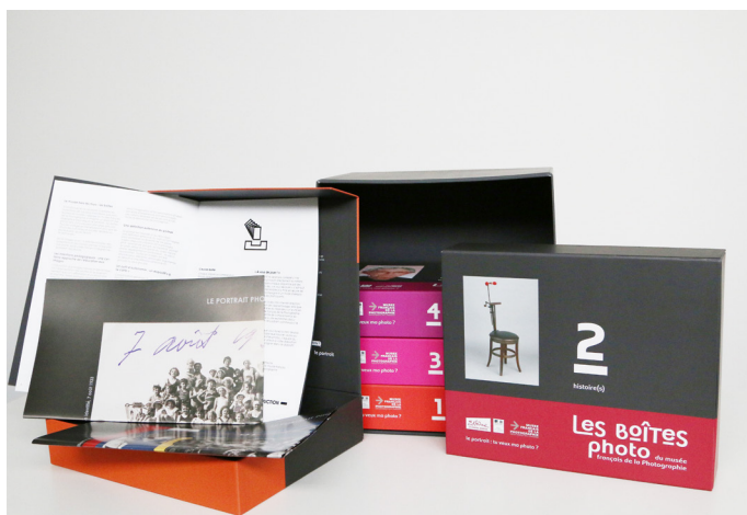
Les Boîtes Photos, du Musée français de la photographie