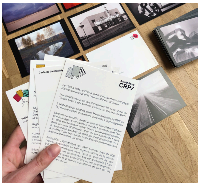
Les cartes des eXplorateurs