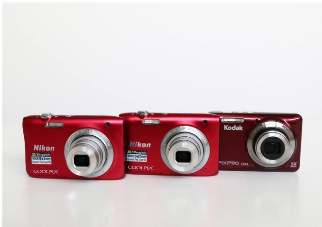
Appareils photos au prêt