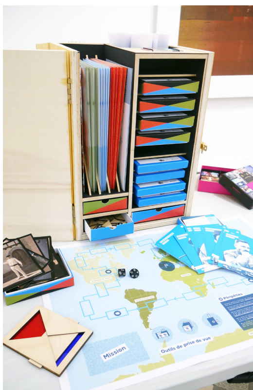
Les Archives de la Planète, du Musée Albert-Kahn © CRP/