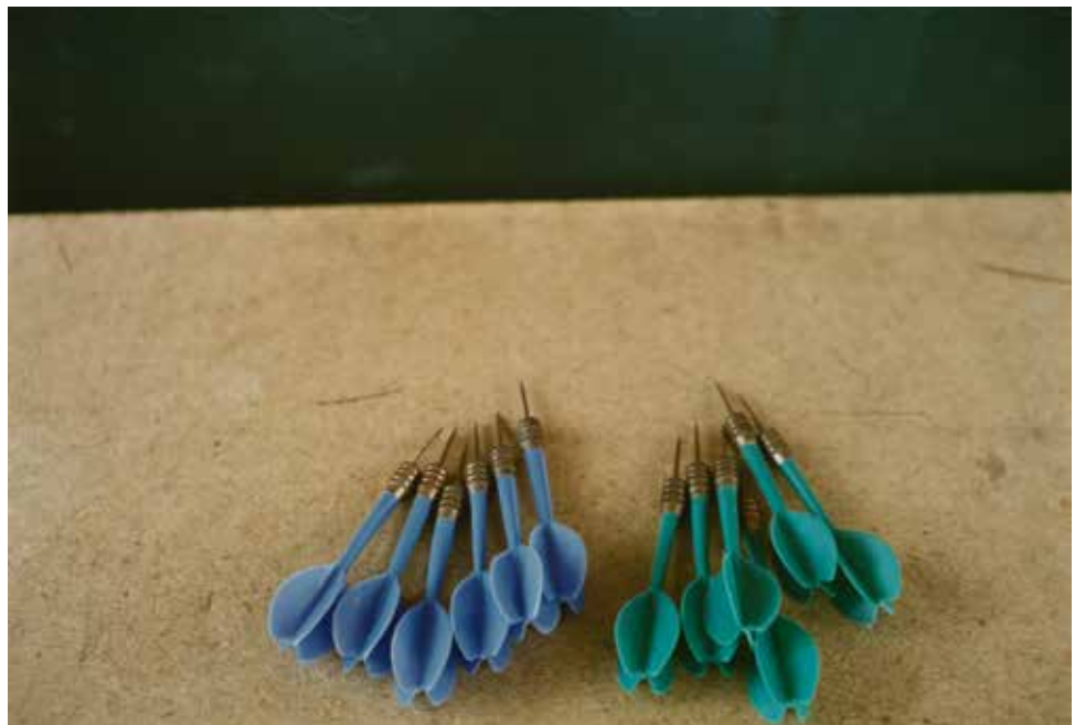
→ Marc GILBERT Couleurs du Nord, Saint-Amand, Fléchettes , 1982, Coll. du CRP/ © Marc Gilbert