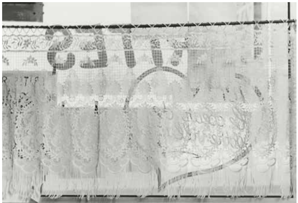
↗ Mary-Ann PARKINSON Espaces, Dechy , 1986, Coll. du CRP/ © Mary-Ann Parkinson