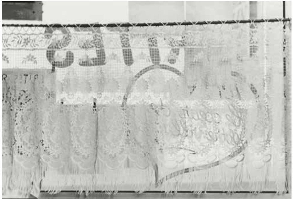
↗ Mary-Ann PARKINSON Espaces, Dechy , 1986, Coll. du CRP/ © Mary-Ann Parkinson