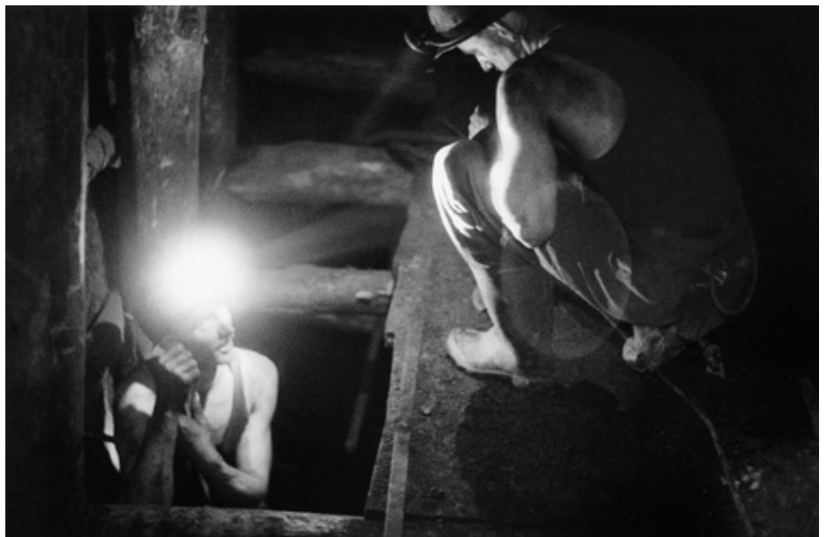
→ « Merlebach », Sans titre, 1958, collection CRP/ © Jean Marquis