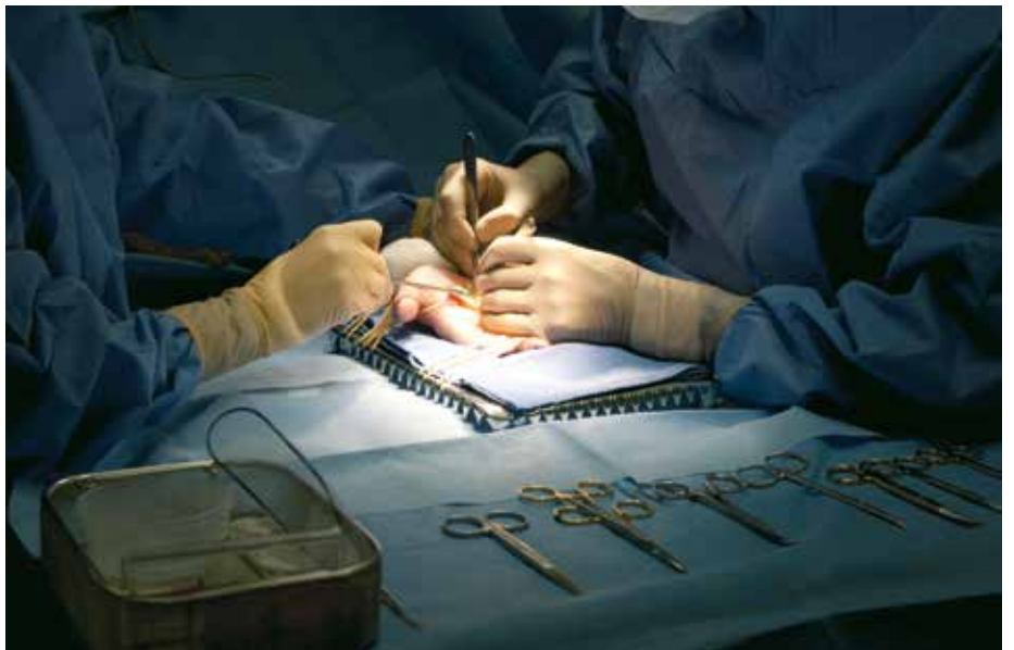
↗ « Corrèze », Sans titre, 1965-1967