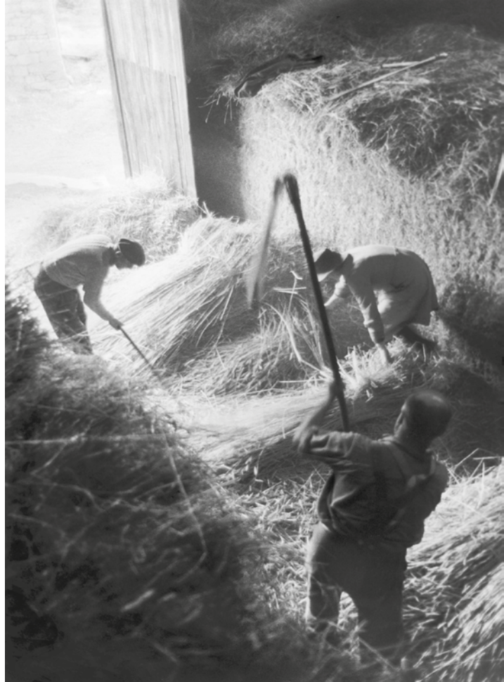
↗ « Corrèze », Battage au fléau, 1965-1967