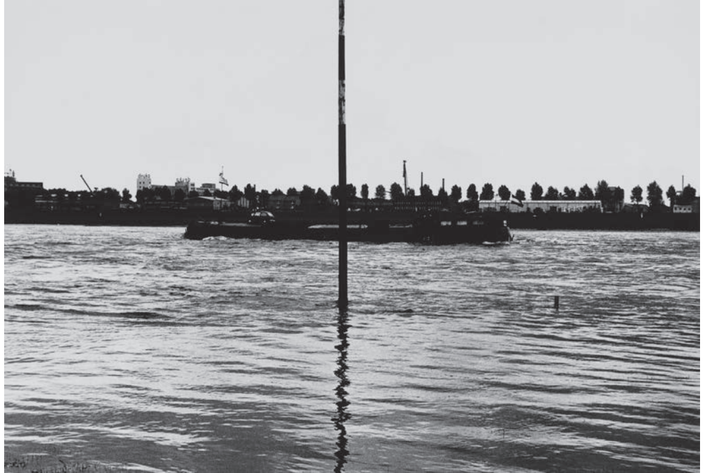
↗ Peter Downsbrough, And, Untitled , 1997, 18,8 x 28,6 cm, Collection CRP/ © Peter Downsbrough