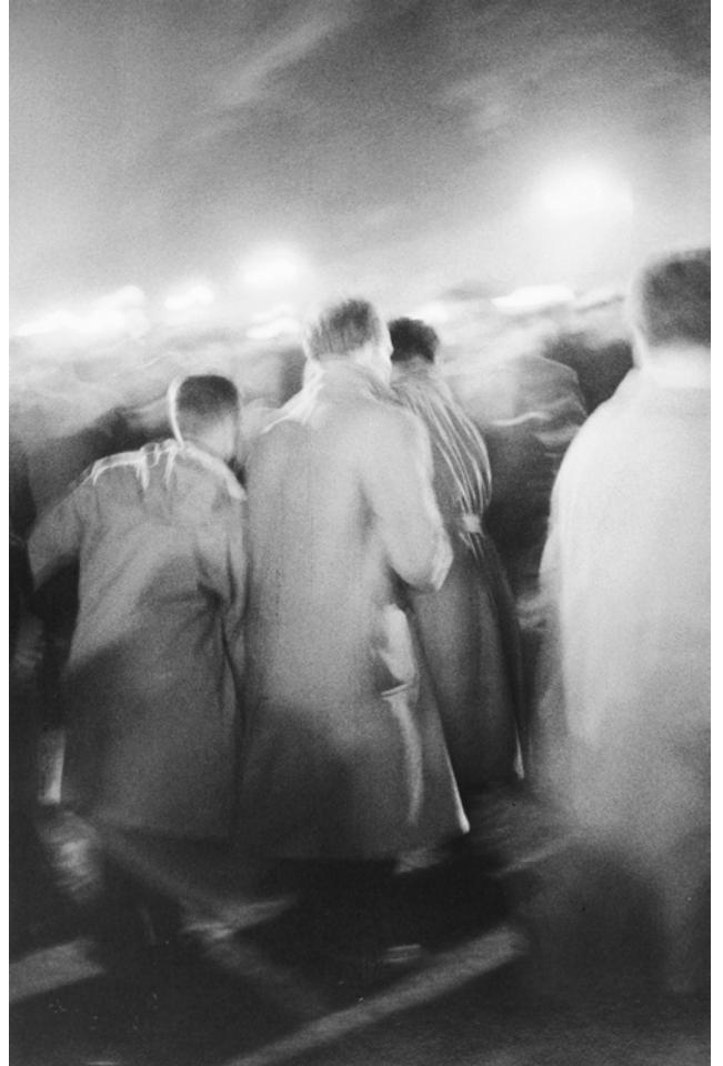
↘ Claude Dityvon, Boulevard Saint Michel, Paris, mai 68 , 1968, 23,1 x 33,9 cm, Collection CRP/ © Claude Dityvon