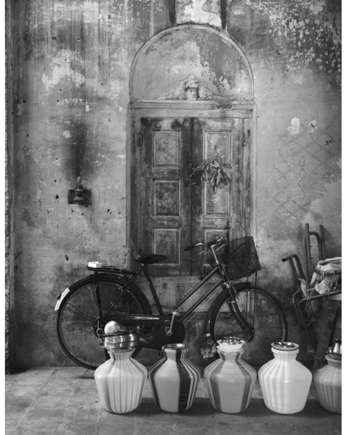
↘ Rémi Guerrin, Tombeau royal de Gia Long , Hué, Vietnam , 2007, 6 x 12 cm, Collection CRP/ © Rémi Guerrin