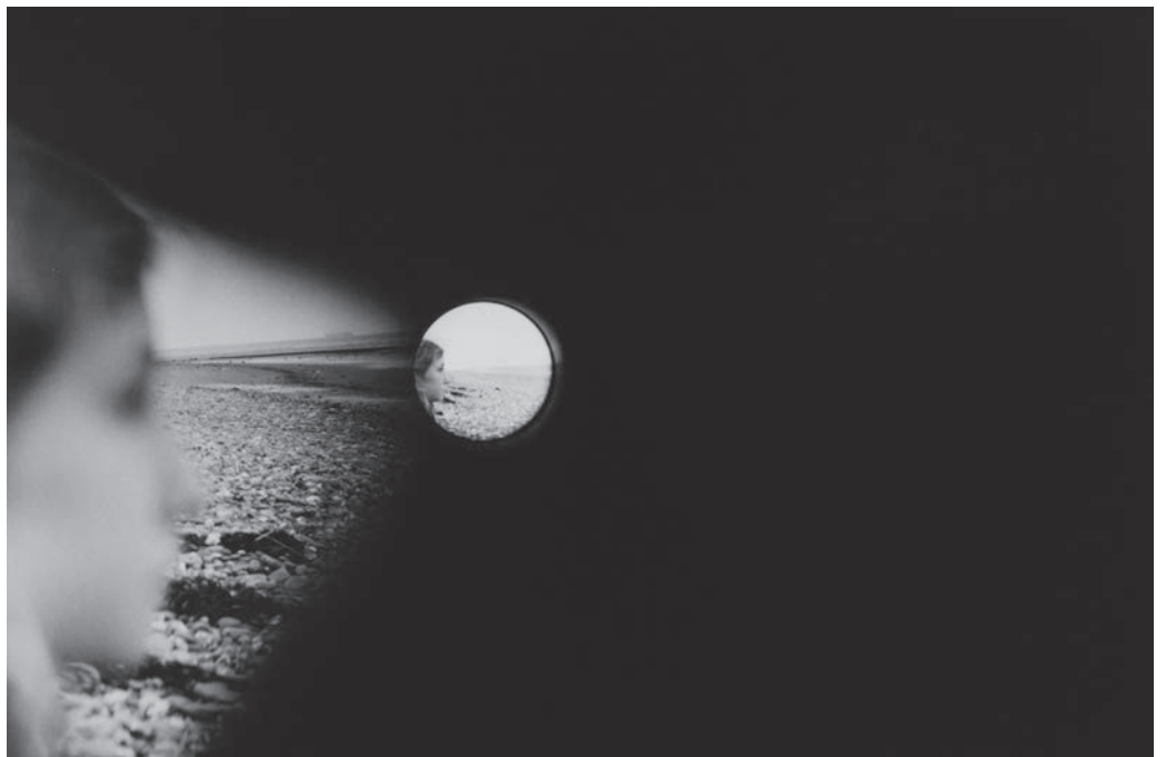
↘ Alexandre Christiaens, Marine XXIII, Mathilde , 2001, 30,4 x 45,2 cm Collection CRP/ © Alexandre Christiaens