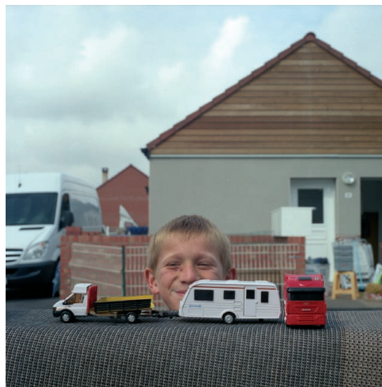
© Virginie Laurent, Quand je serai grand , série Les Voyageurs , 2009, production CRP