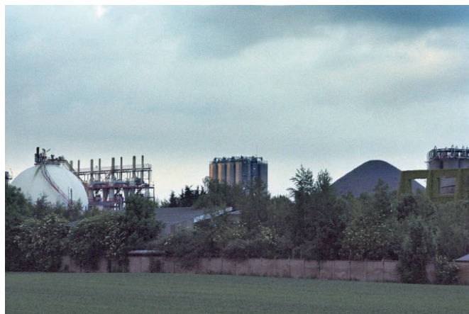
© Victor Costales & Julia Rometti, extrait de « Post-tropics on anthracite wonder », 2009, installation produite par le CRP