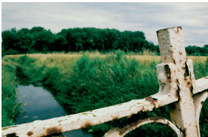
© Luce Choules, EAU paysage, l'Ancienne Scarpe, France, 2009.