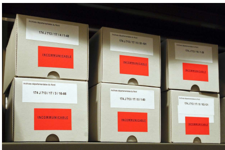
Archives du Nord, S.B. 1-41, photographie couleur 60 x 80 cm.