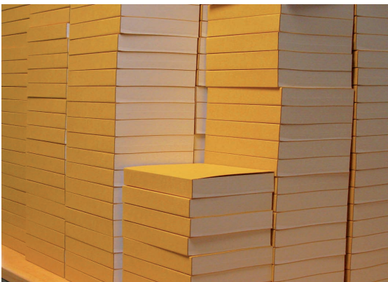
Rotondifolia , fabrication des 300 exemplaires vierges, 2009.

* Rotondifolia se réfère à la bibliothèque d'Aby Warburg (1866-1929) né à Hambourg. Il était historien de l'art spécialiste de la Renaissance en Occident et iconographe. Ses concepts sont établis sur des recherches interdisciplinaires et la notion d'échange. Ses Livres sont conservés au Warburg Institute à Londres, qui est rattaché à l'Université de Londres. Sa bibliothèque est constituée de rayonnages circulaires, sans classification ordonnée, elle permet tous les déplacements et tous les échanges entre les ouvrages. Désormais ouverte au public, elle est riche de plusieurs milliers d'ouvrages, d'ethnologie, d'histoire des religions, de philosophie, d'astrologie.