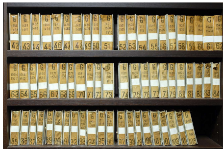
Archives du Nord, S.B. 6-54, série de 5 photographies couleurs, extrait, 40 x 60 cm chaque.