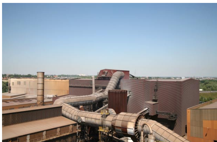
EE 11 / 2010, tirage Lambda couleur, 108,5 x 148,5 cm.

École Supérieure des Beaux-Arts, 132 avenue du Faubourg de Cambrai, Valenciennes.