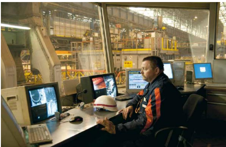
GR 07 / 2010, tirage Lambda couleur; 56 x 82,5 cm. © Claire Chevrier et CRP.

Format: 28 x 24 cm à l'italienne, pages : 120 pages, reproductions en quadrichromie, broché avec rabats, langues: français / anglais, prix public: 32 €