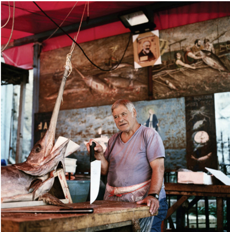
↑ Sans titre, Méditerranée , 2013, 82 x 82 cm, production CRP