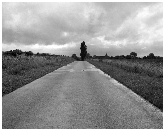
Transfrontalière, La Folie , France, juillet 2008, 94 x 120 cm. Commande « Photographie et Territoire 2008 » du Centre Régional de la Photographie Nord Pas-de-Calais.

Toutes les photographies sont tirées sur papier argentique baryté.